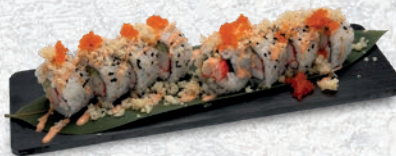
32 KANI ROLL* GAMBERI COTTO, SURIMI, CETRIOLO, SALSA SPICY, TOBIKO