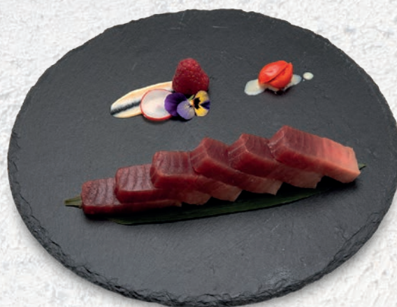
105 MAGURO TONNO 6 PZ