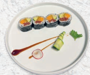
66 VEGANO PEPERONI, ZUCCHINI FRITTI, POMODORI SECCHI € 7,00