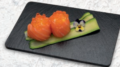
88 IKURA SPECIAL* SALMONE, IKURA, AVOCADO, PHILADELPHIA € 5,00