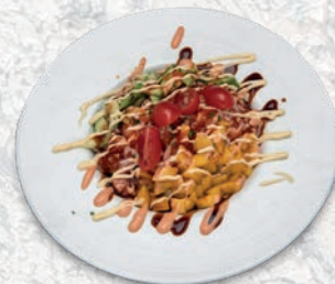
92 SAKE TARTAR TARTARE DI SALMONE, AVOCADO, POMODORO, MANGO, SALSIA SPICY € 10,00