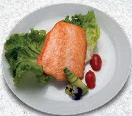
153 SALMONE ALLA PIASTRA