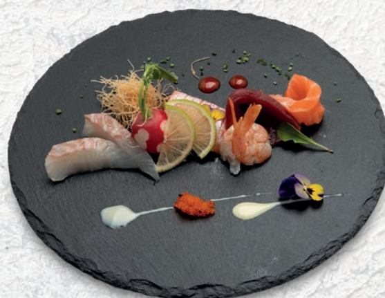
107 SASHIMI MISTO 2 MISTO PESCE 7PZ