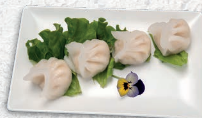
126 RAVIOLI DI GAMBERI*