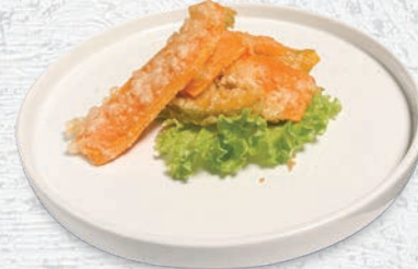
147 TEMPURA SWEET* ZUCCA E PATATE DOLCI € 6,00