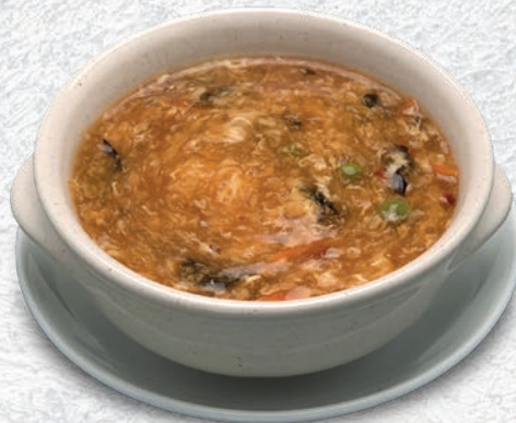
138 ZUPPA AGRO-PICCANTE