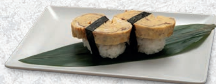
09 TAMAGO UOVA € 2,00