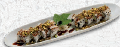
38 VEGETARIANO PEPPERONI ZUCCHINI FRITTI, PHILADELPHIA, SALSA TERIYAKI, PISTACCHIO