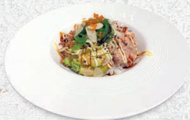
93 SALMONE COTTO SALMONE COTTO, CIPOLLE FRITTE, WAKAME, POMODORO, AVOCADO, TERIYAKI, MAIONESE, MANDORLE € 8,00