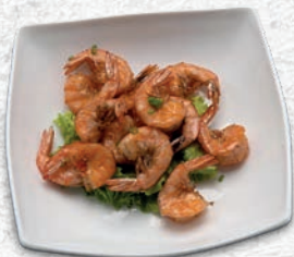
182 GAMBERI SALE E PEPE* € 6,00