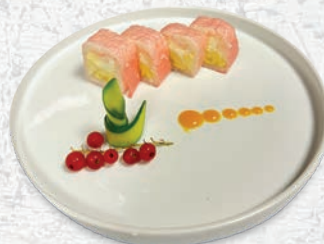
65 PINK LADY FRUTTA, FOGLI DI SOIA, PHILADELPHIA € 7,00