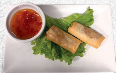
121 INVOLTINI DI VIETNAMITI VERDURE, SPAGHETTI DI SOIA, CARNE, PICCANTE