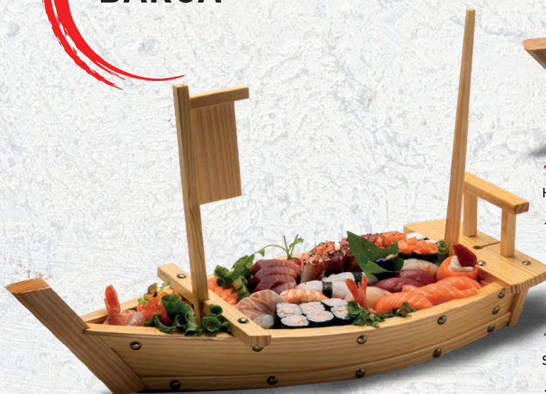
111 BARCA MAX 42 PZ URAMAKI 8PZ, NIGIRI 9PZ, SASHIMI MISTO 15PZ, HOSOMAKI 8PZ, GUNKAN 2PZ