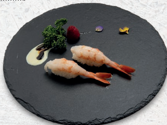
14 AMAEBI* GAMBERI CRUDO € 4,00