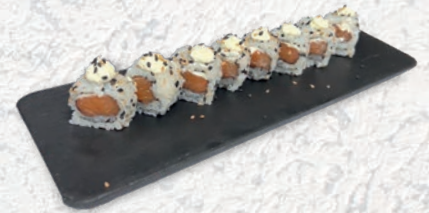
30 SALMONE PHILADELPHIA SALMONE, PHILADELPHIA