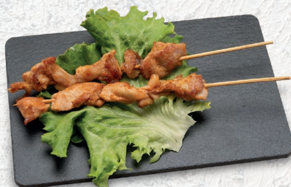
152 SPIEDINI DI POLLO*