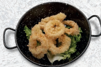
144 CALAMARI FRITTI* € 5,00