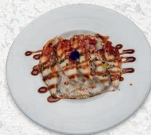
95 UNAGI* ANGUILLA, SALSIA TERIYAKI € 10,00