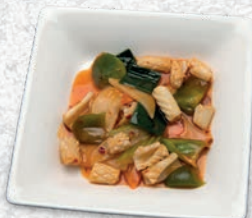
188 CALAMARI PICCANTE CON VERDURE* € 7,00