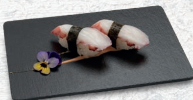
07 TAKO* POLPO € 3,00