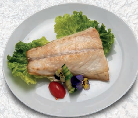
154 BRANZINO ALLA PIASTRA