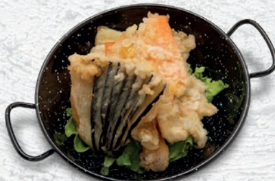
143 TEMPURA VERDURE MISTE € 6,00