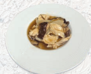
187 POLLO BAMBÙ E FUNGHI* € 6,00