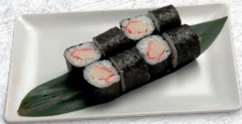
57 KANI* SURIMI € 3,50