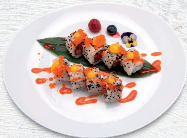
20 SPICY MAGURO TARTARE TONNO, TOBIKO, SALSA MANGO, PICCANTE € 10,00