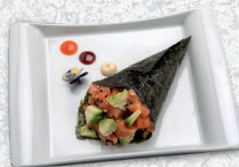
76 SAKE SALMONE, AVOCADO € 3,50