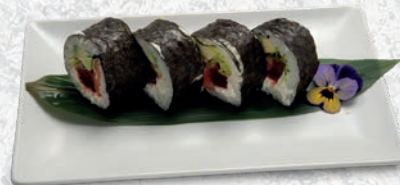
63 CLASSICO SALMONE, TONNO, PHILADELPHIA, AVOCADO, INSALATA € 7,00