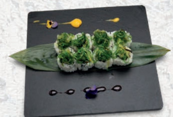
39 WAKAME* INSALATA, AVOCADO, CETRIOLO, GOMA WAKAME