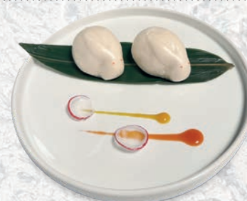
129 PANE USAGI* PANE IN LATTE E CREMA ALL'UOVO