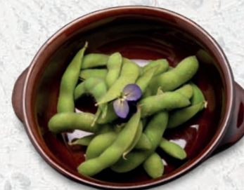
132 EDAMAME* FAGIOLI DI SOIA