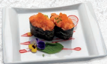
83 SAKE SALMONE, TOBIKO, SALSIA MANGO € 4,00