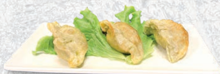
128 RAVIOLI DI VERDURE FRITTI*