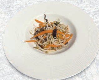
189 GERMOGLI DI SOIA SALTATI € 4,00