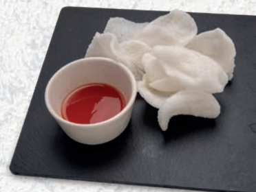
123 NUVOLE DI GAMBERI