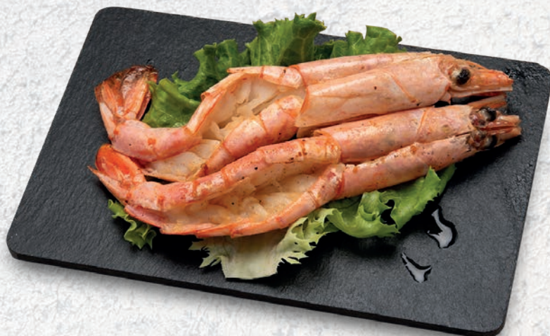
150 GAMBERONI ALLA PIASTRA*