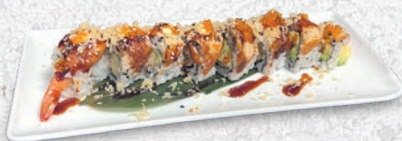
37 UNAGI ROLL* TEMPURA GAMERI, CETRIOLI, ESTERNO ANGUILLA, SALSA TERIYAKI, CRISPY, TOBIKO, MAIONESE