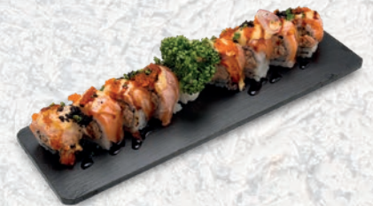
33 HOME ROLL SALMONE COTTO, PHILADELPHIA, ESTERNO SALMONE SCOTTATO, TOBIKO, TERIYAKI