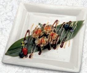
62 CROCCANTE* TEMPURA GAMBERO, AVOCADO, CETRIOLI, CRISPY, TOBIKO, SALSA TERIYAKI, MAIONESE € 7,00