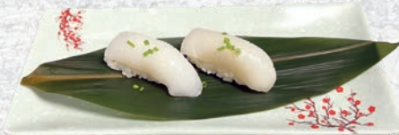
10 IKA* SEPPIA € 3,00