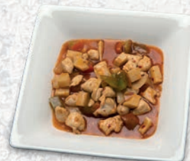
184 POLLO PICCANTE* € 6,00