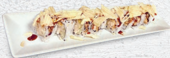
24 CHICKEN ROLL* POLLO FRITTO, CETRIOLO, TERIYAKI, MAIONESE, PATATINE € 9,00