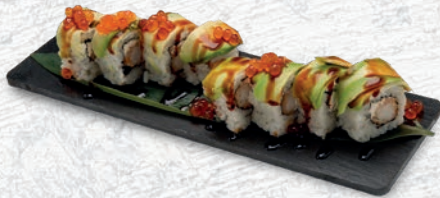
28 DRAGO PLUS* TEMPURA GAMBERO, PHILADELPHIA, ESTERNO AVOCADO, TOBIKO, TERIYAKI