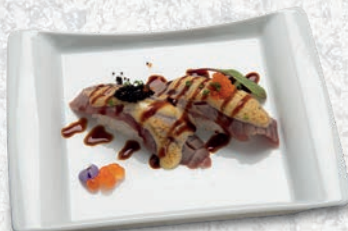
13 TONNO SCOTTATO € 4,00