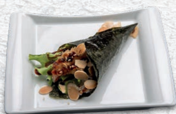
75 EBITEN* TEMPURA GAMBERO, INSALATA, PHILADELPHIA, TERIYAKI € 4,00