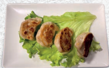
124 RAVIOLI DI CARNE ALLA PIASTRA