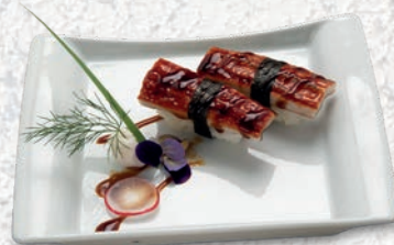
05 UNAGI* ANGUILLA € 3,50