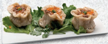
127 SHAOMAI DI GAMBERI E CARNE*