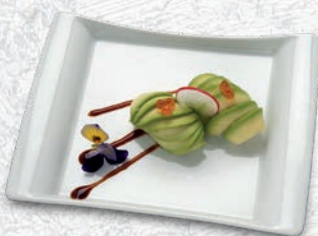
06 AVOCADO AVOCADO € 2,00