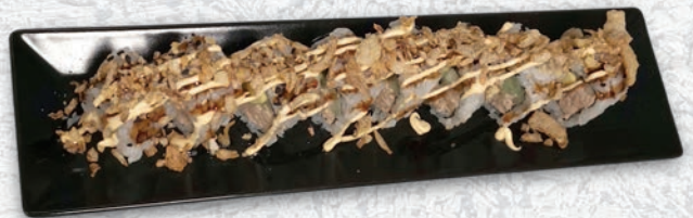
23 SPECIAL CALIFORNIA TONNO COTTO, CETRIOLO, AVOCADO, CIPOLLE FRITTE, SALSA SPICY € 10,00