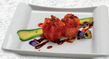
87 SAKE FLÒ TARTARA DI SALMONE, SALSIA TERIYAKI € 5,00