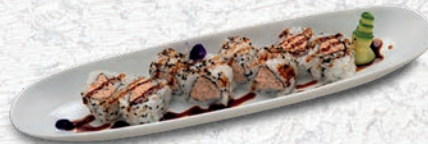
29 MIURA SALMONE COTTO, PHILADELPHIA, SALSA TERIYAKI