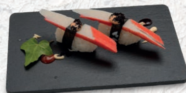
08 KANI* SURIMI € 2,00