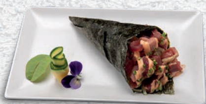
77 SPICY MAGURO TONNO, CETRIOLO, CIPOLLINA, SALSA SPICY € 4,50