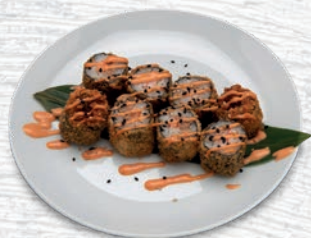
71 HOSOMAKI SPECIAL* GAMBERI COTTO, TONNO COTTO, SALSA SPICY € 6,50