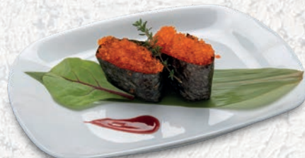
85 TOBIKO* UOVA DI PESCE VOLANTE € 3,50