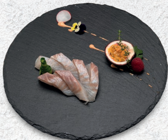
104 SUZUKI BRANZINO 6 PZ