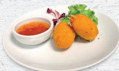
146 CHELE DI GRANCHIO FRITTE* € 3,50