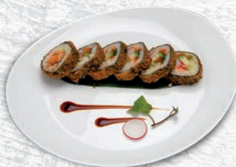
72 SAKE FUTO* SALMONE, SURIMI, AVOCADO, SALSA TERIYAKI € 7,00