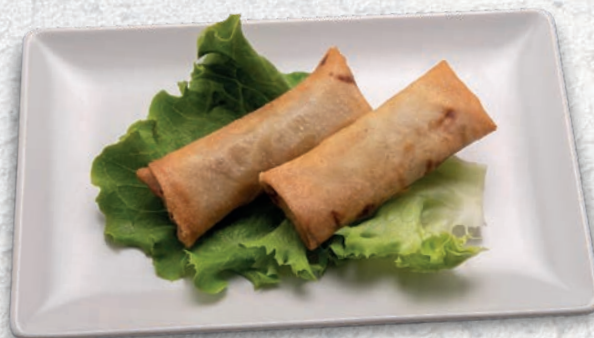
120 INVOLTINI DI PRIMAVERA VERDURE