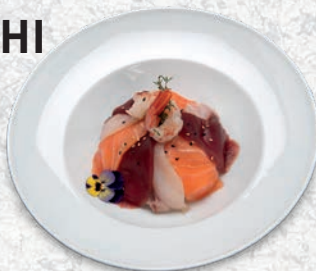
91 MISTO RISO, MISTO PESCE € 8,00