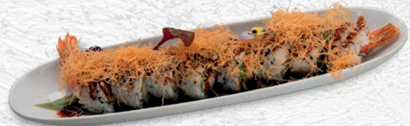
19 EBITEN* TEMPURA GAMBERO, PHILADELPHIA, KATAIFI, TERIYAKI € 9,00