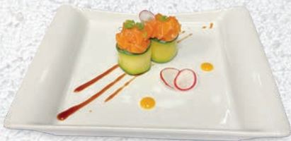
81 SAKE ZUCCHINE TARTARA DI SALMONE, TERIYAKI, CIPOLLINA € 5,00