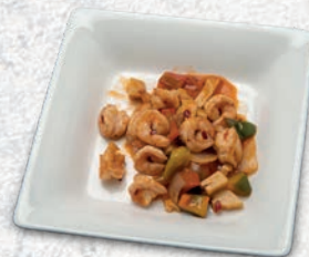
181 GAMBERI PICCANTE* € 6,00