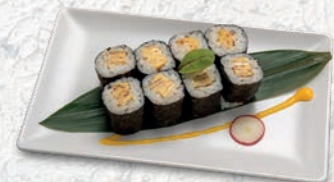
59 TAMAGO UOVA € 3,50