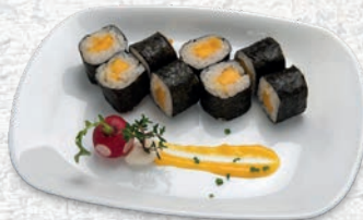
58 MANGO MANGO € 4,00