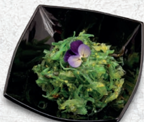
130 GOMA WAKAME* ALGHE FRESCHES