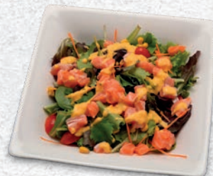
135 SAKE SALAD INSALATA MISTA, SALMONE E SALSA FRUTTA € 6,00