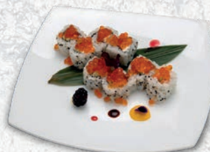
35 IKURA* SALMONE, PHILADELPHIA, CETRIOLO, UOVA DI SALMONE