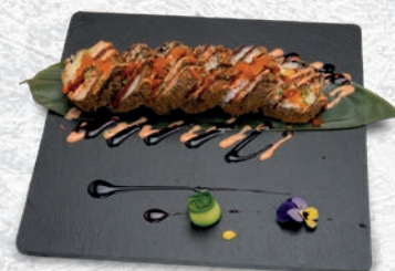
73 MAX ROLL* SALMONE, SURIMI, AVOCADO, CETRIOLO, TOBIKO, CIPOLLINA, TERIYAKI, SPICY € 8,00