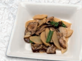
190 FUNGHI E BAMBÙ € 4,50