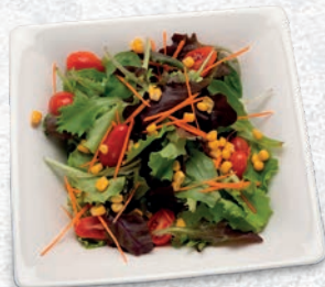
134 INSALATA CLASSICO VERDURE MISTE € 4,00