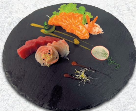
106 SASHIMI MISTO 1 MISTO PESCE 15PZ