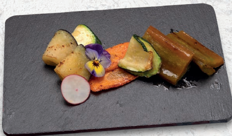
155 VERDURE MISTE ALLA PIASTRA