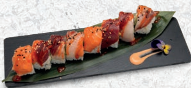
34 SPECIAL ROLL SENZA ALGHE, AVOCADO, PHILADELPHIA, PESCE MISTO, SALSA PICCANTE