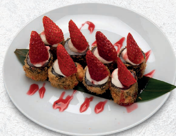
70 HOSOMAKI PRO SALMONE, PHILADELPHIA, FRUTTA, KATAIFI € 6,50