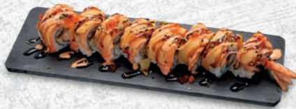
31 CHEESE ROLL* TEMPURA GAMBERI, SALMONE, CHEESE, TERIYAKI, SPICY