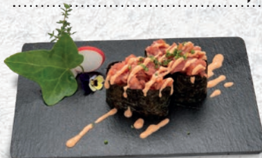
84 MAGURO TONNO, CIPOLLINA, SALSIA SPICY € 4,00