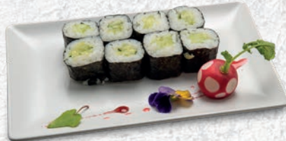
55 CETRIOLI CETRIOLI € 3,50