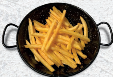
142 PATATINE FRITTE* € 2,50