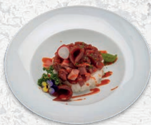
94 MAGURO TARTAR TARTARE DI TONNO, CIPOLLINA, SALSIA PICCANTE € 10,00