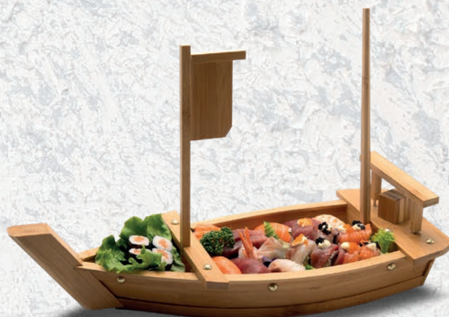
110 BARCA SMALL 24 PZ URAMAKI 8PZ, NIGIRI 6PZ, HOSOMAKI 4PZ, SASHIMI 6PZ