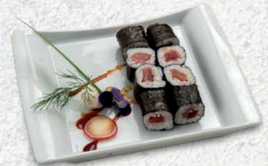
53 MAGURO TONNO € 4,50