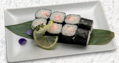
56 EBI* GAMBERI COTTI € 4,00