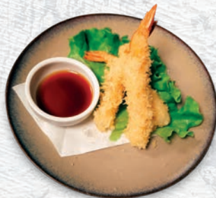
140 TEMPURA GAMBERI* € 8,00