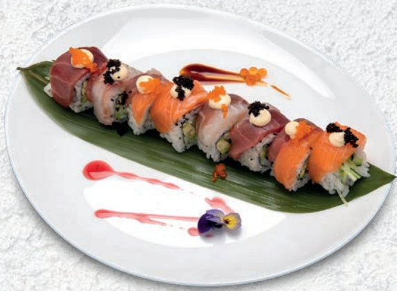
26 RAINBOW ROLL* SURIMI, CETRIOLO, AVOCADO, PESCE MISTO, SALSA TERIYAKI