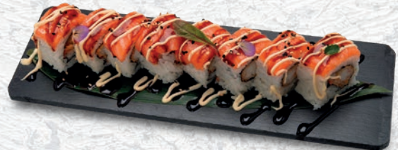
21 TIGRE ROL* TEMPURA GAMBERO, SALMONE, TERIYAKI, MAIONESE € 12,00