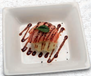
133 TORTINO DI PATATE CON SALMONE SCOTTATO E SALSA TERIYAKI € 4,00