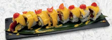
36 MANGO ROLL TONNO, MANGO, SALSA MANGO, POMODORO