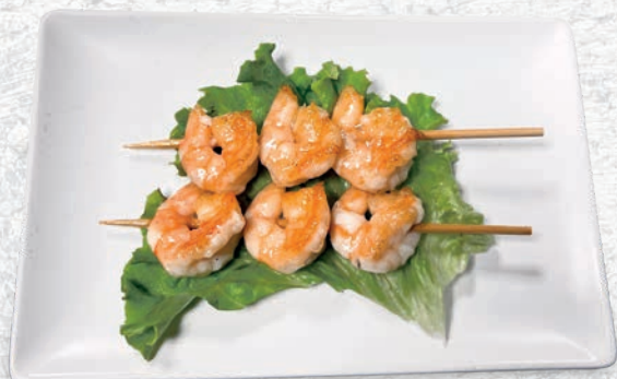
151 SPIEDINI DI GAMBERI*