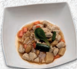
183 POLLO AL MANDORLE* € 6,00