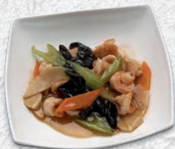
180 GAMBERI CON VERDURE* € 6,00