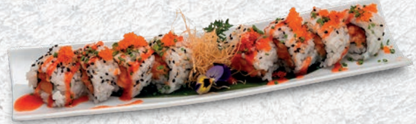
18 SPICY SAKE TARTARE SALMONE, CIPOLLINA, TOBIKO, SALSA PICCANTE € 9,00