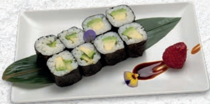
54 AVOCADO AVOCADO € 3,50