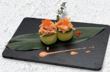
82 ZUCCHINE* GAMBERO COTTO, SURIMI, MAIONESE, TOBIKO, TABASCO € 4,00