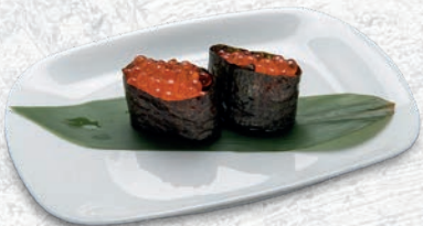
86 IKURA* UOVA DI SALMONE € 5,00