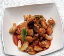
185 POLLO IN SALSA AGRODOLCE* € 6,00