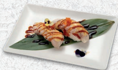
12 BRANZINO SCOTTATO € 3,00