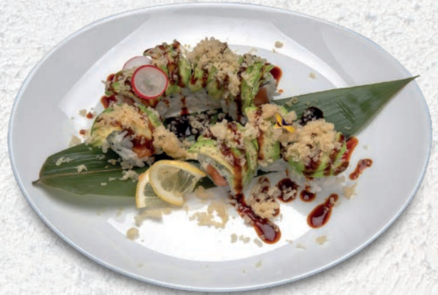
27 DRAGO ROLL SALMONE, PHILADELPHIA, ESTERNO AVOCADO, TERIYAKI, CRISPY