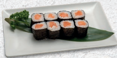
52 SAKE SALMONE € 4,00