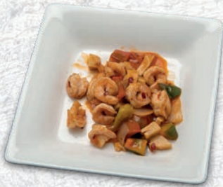
181 GAMBERI PICCANTE*