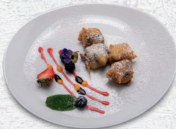
205 NUTELLA FRITTA