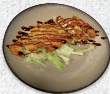
141 POLLO FRITTO* € 5,00