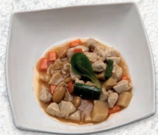
183 POLLO AL MANDORLE*