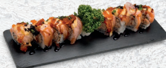
33 HOME ROLL SALMONE COTTO, PHILADELPHIA, ESTERNO SALMONE SCOTTATO, TOBIKO, TERIYAKI