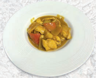
186 POLLO AL CURRY*