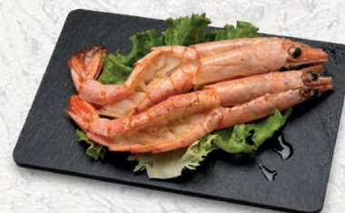
150 GAMBERONI ALLA PIASTRA* € 6,00 ESCLUSO MENÙ ALL YOU CAN EAT € 2,00