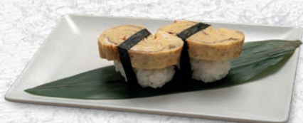
09 TAMAGO UOVA € 2,00