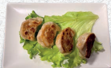
124 RAVIOLI DI CARNE ALLA PIASTRA