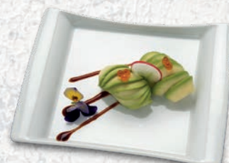
06 AVOCADO AVOCADO € 2,00