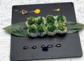
39 WAKAME* INSALATA, AVOCADO, CETRIOLO, GOMA WAKAME