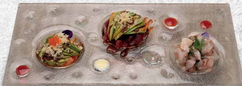
97 TRIS TARTARE SALMONE, TONNO, BRANZINO, AVOCADO € 12,00 ESCLUSO MENÙ ALL YOU CAN EAT € 3,50