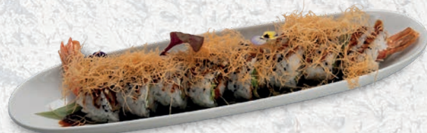
19 EBITEN* TEMPURA GAMBERO, PHILADELPHIA, KATAIFI, TERIYAKI € 9,00