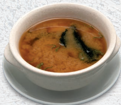
137 ZUPPA MISO