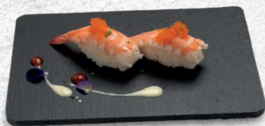
03 EBI* GAMBERO COTTO € 2,50