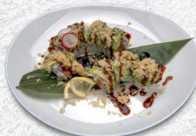
27 DRAGO ROLL SALMONE, PHILADELPHIA, ESTERNO AVOCADO, TERIYAKI, CRISPY