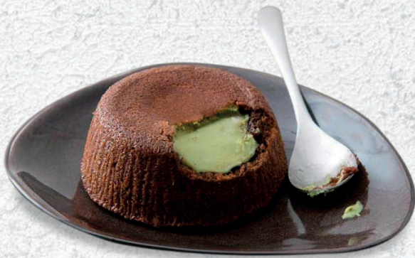
206 TORTINO AL PISTACCHIO