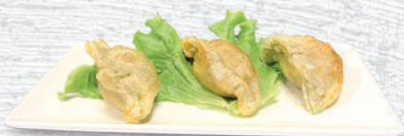
128 RAVIOLI DI VERDURE FRITTI*