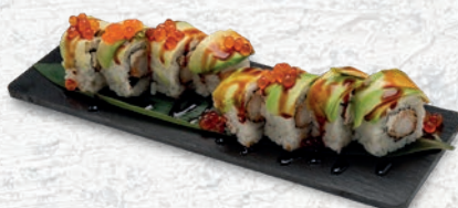
28 DRAGO PLUS* TEMPURA GAMBERO, PHILADELPHIA, ESTERNO AVOCADO, IKURA, TERIYAKI € 12,00 ESCLUSO MENÙ ALL YOU CAN EAT € 3,00