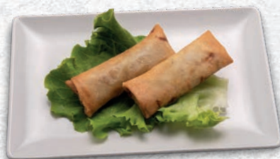
120 INVOLTINI DI PRIMAVERA VERDURE