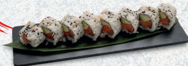
16 SAKE AVOCADO SALMONE, AVOCADO € 7,00