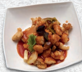
185 POLLO IN SALSA AGRODOLCE*