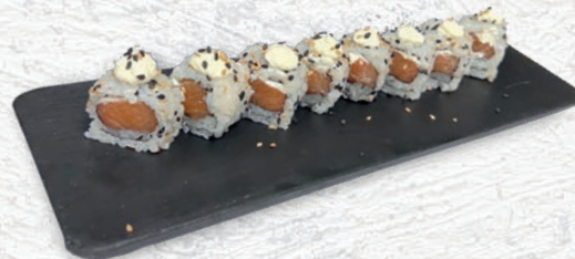
30 SALMONE PHILADELPHIA SALMONE, PHILADELPHIA