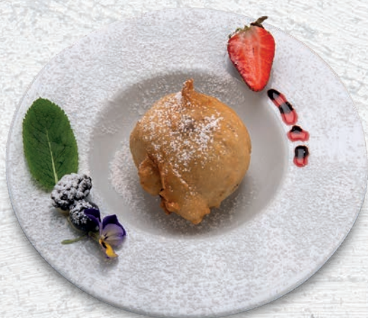
204 GELATO FRITTO