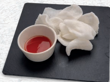
123 NUVOLE DI GAMBERI