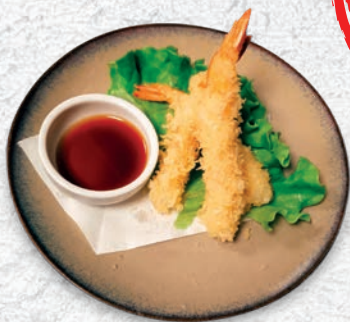
140 TEMPURA GAMBERI* MASSIMO 1 PORZIONE A PERSONA € 8,00