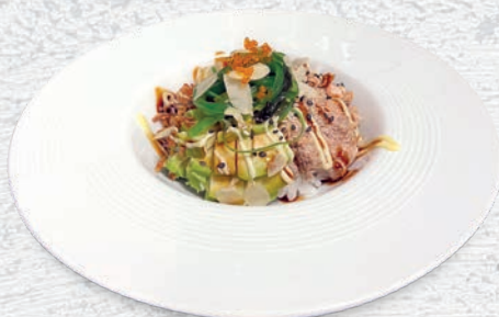
93 SALMONE COTTO SALMONE COTTO, CIPOLLE FRITTE, WAKAME, POMODORO, AVOCADO, TERIYAKI, MAIONESE, MANDORLE € 8,00