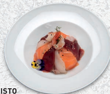
91 MISTO RISO, MISTO PESCE € 8,00