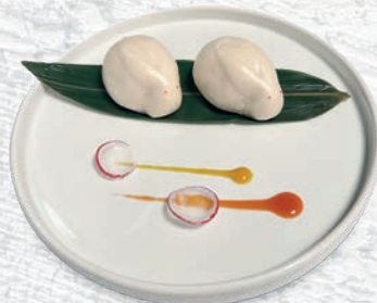
129 PANE USAGI* PANE IN LATTE E CREMA ALL'UOVO