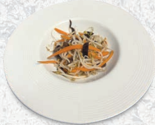
189 GERMOGLI DI SOIA SALTATI