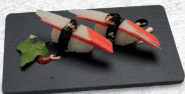
08 KANI* SURIMI € 2,00