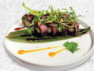
46 RUCOLINA* TEMPURA GAMBERI, ESTERNO TONNO, RUCOLA, SALSA TERIYAKI, MAIONESE € 12,00 ESCLUSO MENÙ ALL YOU CAN EAT € 3,00