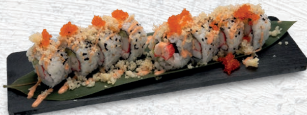
32 KANI ROLL* GAMBERI COTTO, SURIMI, CETRIOLO, SALSА SPICY, TOBIKO