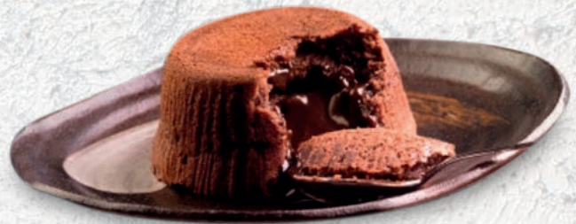
207 TORTINO AL CIOCCOLATO