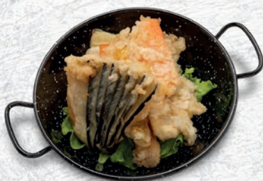
143 TEMPURA VERDURE MISTE € 6,00