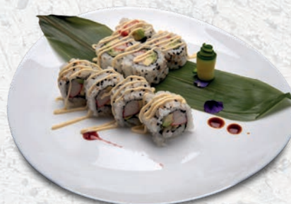
22 CALIFORNIA* SURIMI, CETRIOLO, AVOCADO, MAIONESE € 7,00