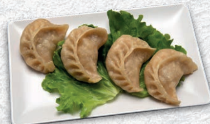
125 RAVIOLI DI CARNE AL VAPORE