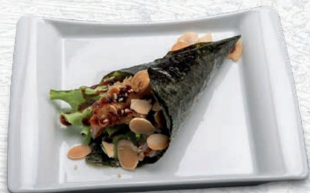
75 EBITEN* TEMPURA GAMBERO, INSALATA, PHILADELPHIA, TERIYAKI € 4,00