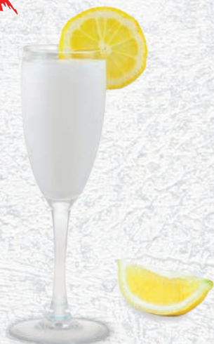
200 SORBETTO AL LIMONE