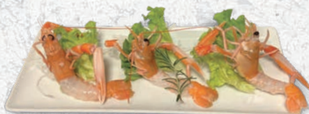
119 SASHIMI SCAMPI 3 PZ € 7,00 ESCLUSO MENÙ ALL YOU CAN EAT € 5,00