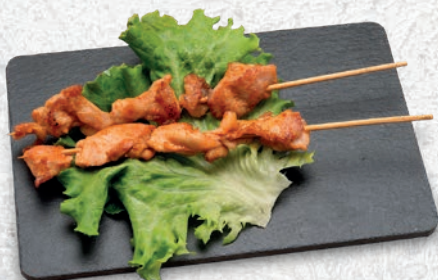
152 SPIEDINI DI POLLO* € 6,00