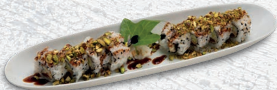
38 VEGETARIANO PEPERONI ZUCCHINI FRITTI, PHILADELPHIA, SALSА TERIYAKI, PISTACCHIO