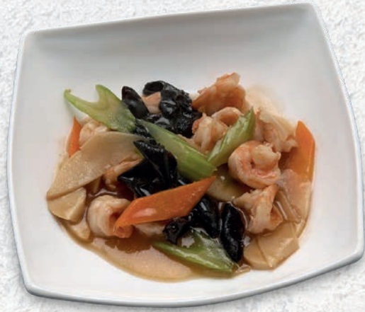
180 GAMBERI CON VERDURE*