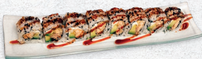
25 SALMONE FRITTO SALMONE FRITTO, AVOCADO, PHILADELPHIA, SALSА TERIYAKI