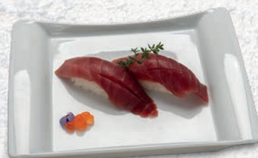
02 MAGURO TONNO € 3,50