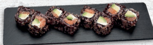
44 SAKE PHILADELPHIA SALMONE CRUDO, AVOCADO, PHILADELPHIA