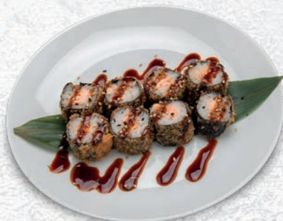
69 HOSOMAKI SAKE SALMONE, SALSA TERIYAKI € 5,00