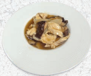
187 POLLO BAMBÙ E FUNGHI*