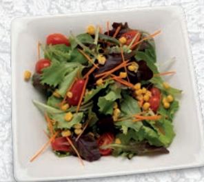
134 INSALATA CLASSICO VERDURE MISTE