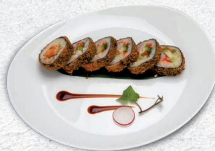
72 SAKE FUTO* SALMONE, SURIMI, AVOCADO, SALSA TERIYAKI € 7,00