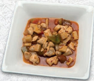
184 POLLO PICCANTE*