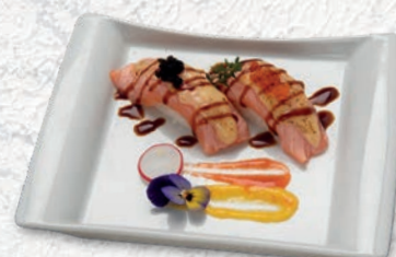
11 SALMONE SCOTTATO € 3,00