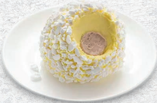
208 TARTUFO BIANCO