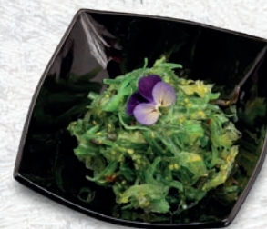
130 GOMA WAKAME* ALGHE FRESCHE