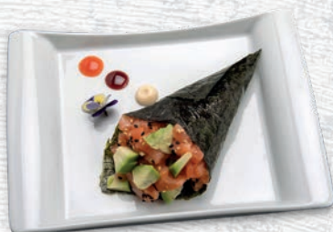
76 SAKE SALMONE, AVOCADO € 3,50