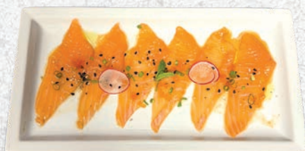
102 CARPACCIO SALMONE 6 PEZZI SALMONE € 5,00 ESCLUSO MENÙ ALL YOU CAN EAT € 2,00