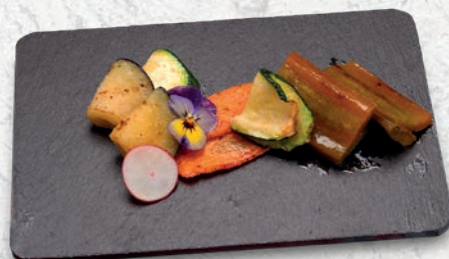
155 VERDURE MISTE ALLA PIASTRA € 5,00