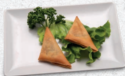
122 SAMOSA AL CURRY*