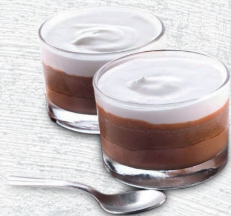
202 MOUSSE TRE CIOCCOLATO