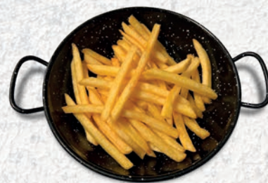
142 PATATINE FRITTE* € 2,50