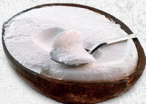
210 GELATO AL COCCO