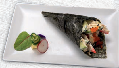
78 CALIFORNIA* SURIMI, AVOCADO, CETRIOLO, MAIONESE, TOBIKO € 4,00