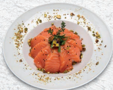
90 CHIRASHI SALMONE RISO, SALMONE € 7,00