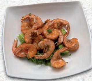
182 GAMBERI SALE E PEPE*