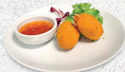
146 CHELE DI GRANCHIO FRITTE* € 3,50