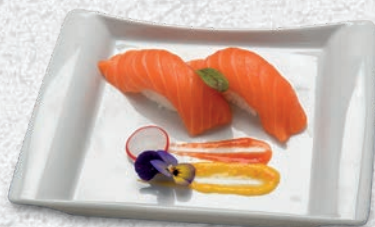
01 SAKE SALMONE € 2,50