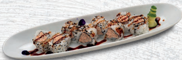
29 MIURA SALMONE COTTO, PHILADELPHIA, SALSА TERIYAKI