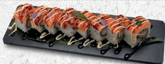
21 TIGRE ROL* TEMPURA GAMBERO, SALMONE, TERIYAKI, MAIONESE € 12,00