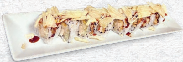
24 CHICKEN ROLL* POLLO FRITTO, CETRIOLO, TERIYAKI, MAIONESE, PATATINE