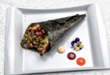
79 SALMONE COTTO SALMONE, AVOCADO, SALSA TERIYAKI E PICCANTE, PISTACCHIO € 5,00