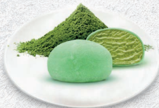
201 MOCHI GELATO A SCELTA 2 GUSTI:

CIOCCOLATO, MANGO, SESAMO, THE VERDE, VANIGLIA