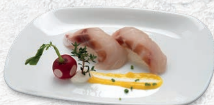
04 SUZUKI BRANZINO € 2,50