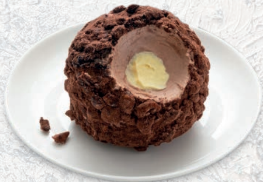
209 TARTUFO NERO