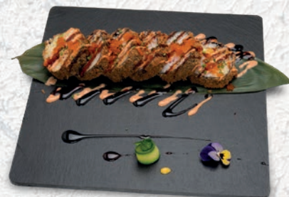
73 MAX ROLL* SALMONE, SURIMI, AVOCADO, CETRIOLO, TOBIKO, CIPOLLINA, TERIYAKI, SPICY € 8,00 ESCLUSO MENÙ ALL YOU CAN EAT € 2,50