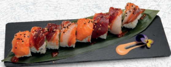
34 SPECIAL ROLL SENZA ALGHE, AVOCADO, PHILADELPHIA, PESCE MISTO, SALSА PICCANTE