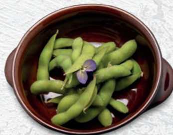
132 EDAMAME* FAGIOLI DI SOIA