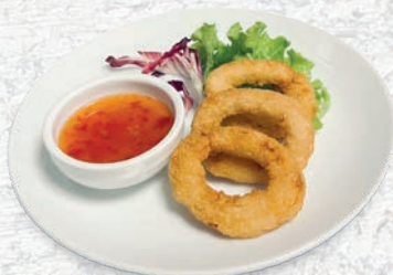
145 ANELLI DI CIPOLLA FRITTI* € 3,00