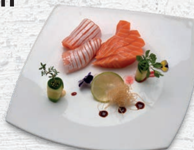
103 SAKE SALMONE 6 PZ MASSIMO 1 PORZIONE A PERSONA € 6,00