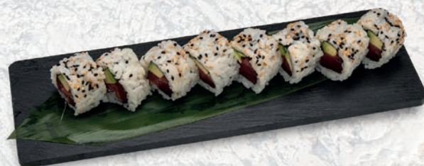
17 MAGURO AVOCADO TONNO, AVOCADO € 8,00