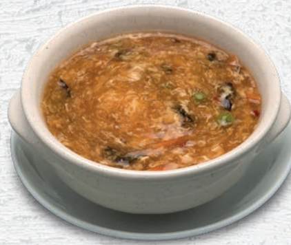
138 ZUPPA AGRO-PICCANTE