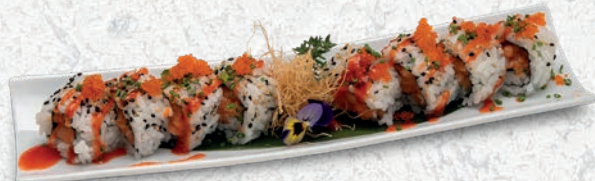
18 SPICY SAKE TARTARE SALMONE, CIPOLLINA, TOBIKO, SALSA PICCANTE € 9,00