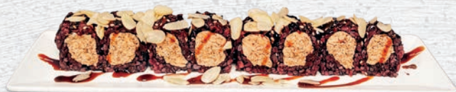
43 MIURA ROLL SALMONE COTTO, PHILADELPHIA, SALSА TERIYAKI, MANDORLE